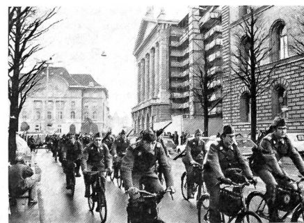
Angehörige der Rdf-Truppe, die am 25. November 1972 in Bern mit Erfolg gegen die drohende Auflösung ihrer Einheiten demonstrierten.

Bekanntlich nimmt der Anteil der Militärausgaben am Bundeshaushalt eher ab als zu; die finanziellen Mittel sind knapp, allenthalben müssen Abstriche in Kauf genommen werden, auf 60 neue Flugzeuge wird verzichtet, für eine Neueinkleidung aber sind die Millionen vorhanden! Eine neue Uniform übrigens, die genau wie die jetzige nur im Ausgang getragen wird.