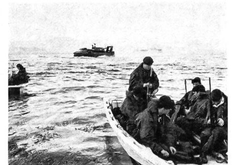
Englische Marinefüsilier der 3. Kommando-Brigade werden mit leichten Sturmbooten in einem norwegischen Fjord an Land gesetzt. Im Hintergrund erkennt man die militärische Version eines Luftkissenbootes (Hovercraft).

Im September 1972 fanden im Raum Nordatlantik die grössten Land-, See- und Luftmanöver der NATO seit den Silver-Tower-Übungen von 1968 statt. Nicht weniger als elf NATO-Staaten, die zusammen 64 000 Mann, 300 Schiffe und 700 Flugzeuge stellten, nahmen daran teil.