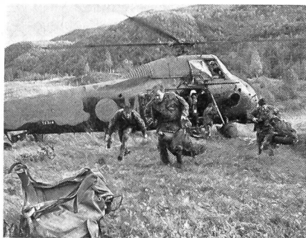
Im Eiltempo räumen diese britischen, vom Helikopterträger «HMS Albion» aus an Land geflogenen Marinefüsiliere die Maschine, damit diese zu einer zweiten Tour starten kann.

Die Übungsgebiete erstreckten sich über den ganzen Atlantik bis hinauf nach Nordnorwegen, in die Nordsee, in den Ärmelkanal und rund um die Iberische Halbinsel. Hier testete man U-Boot- und Anti-U-Boot-Kriegführung, Minenlege- und Minensuchverfahren (Teilnahme von Verbänden der französischen Marine!) sowie Flugabwehr-, landgestützte Patrouillenflug- und trägergestützte Fliegeroperationen. Höhepunkt bildeten aber zweifellos zwei amphibische Landungsoperationen bei Tromsø und Narvik, wo gegen 4000 Marinefüsiliere der USA, Grossbritanniens und Hollands nördlich des Polarkreises an Land gesetzt wurden. Sie stiessen dabei auf den «Widerstand» von 5000 Mann der AMF (Allied Mobile Force, oft auch als «NATO-Feuerwehr» bezeichnet), eines Heeresverbandes, der sich aus Landtruppen verschiedener NATO-Staaten zusammensetzt. Die Landungen wurden u. a. von amerikanischen und britischen Flugzeugträgern unterstützt.