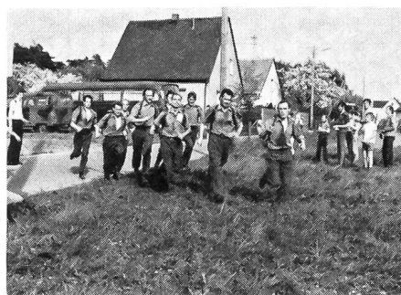
Schweiz II im Zieleinlauf