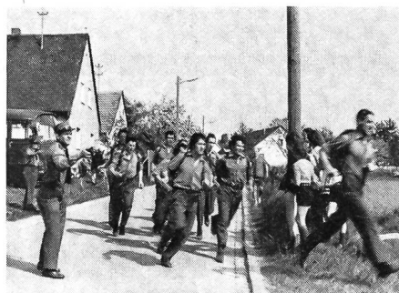
Schweiz I im Zieleinlauf

Ein Parcours von 12 km Länge war mit 7,5 kg Rucksackgewicht in einem Vorlauf und einem Endlauf zu absolvieren. Im ersten Durchgang wurden die 18 besten Gruppen für den Endlauf ermittelt, wobei unsere beiden Gruppen die besten Zeiten erzielten.