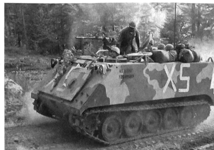
Eine Gruppe verschiebt sich im Spz M-113.

Stab der genannten Division in Würzburg, nicht zustande gekommen wäre. Seine Ausführungen in fließendem «Züritütsch» gaben diesem lehrreichen Besuch eine besondere Note. Mancher Schweizer erlebte in eindrücklicher Weise — die Amerikaner machten daraus auch keinen Hehl —, dass trotz modernstem Material noch immer der Mensch die Taktik bestimmt und die Gefechtstechnik anwendet. Auch Computer