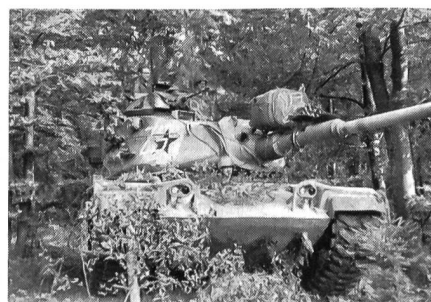
M-60 in Lauerstellung

Es muss besonders hervorgehoben werden, dass dieser Besuch ohne die Bemühungen des Air Cavalry und Fallschirmjäger-Majors Ronald Hofmann, Bürger der USA und der Schweiz, gegenwärtig im