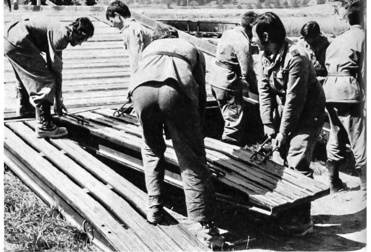
Die Rampenplatten werden eingebaut.