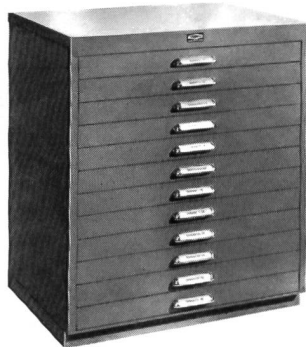
DB 12 Schubladenschrank

Alle Touswiss Möbel können beliebig ausgerüstet werden. Die robuste Konstruktion und äußerst sorgfältige Fertigung entsprechen der über 35jährigen bekannten Touswiss Qualität.