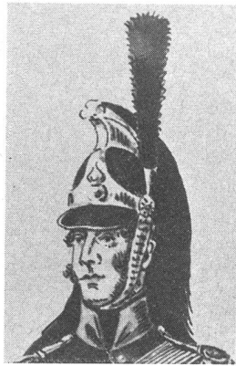
Helm mit Mähne eines Offiziers des freiwilligen Reiterkorps. Ordonnanz von 1810. Alle Metallteile gelb. Federstutz und Mähne schwarz. Aquarell von Hans Wilhelm Harder. Historische Sammlung des Museums zu Allerheiligen, Schaffhausen, kopiert von A. Pochon.