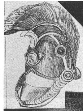
Reiterhelm mit schwarzer Bürstenmähne eines reitenden Jägers. 1846/47. Gelbe Metallteile. Kokarde: innen schwarz, aussen grün. Historisches Museum im Schloss Thun.