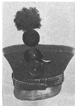
Tschako eines Artilleristen, um 1830. Gelbe Metallteile. Kokarde: innen schwarz, aussen grün. Gänse, Pompon und Flamme scharlachrot. Ehemalige Sammlung Henri Pelet.