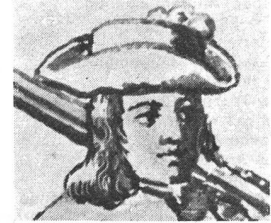
Aufgeschlagener Filzhut für einen Soldaten, um 1728. Aus einem, von Johannes Greuter zu Roggwil gestifteten Glasfenster. Histor. Museum Bern.