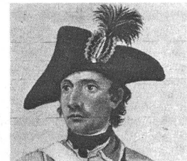
«Christian Reichenbach, Wachtmeister der Berner Zuzüger» an der Grenze, 1792. Aus einer aquarellierten Zeichnung von Franz Niklaus König. Kunstmuseum Bern.