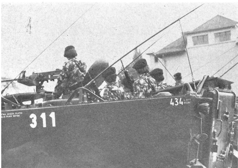
3 Die Panzergrenadiere defilierten auf dem bewährten Schützenpanzer 63.