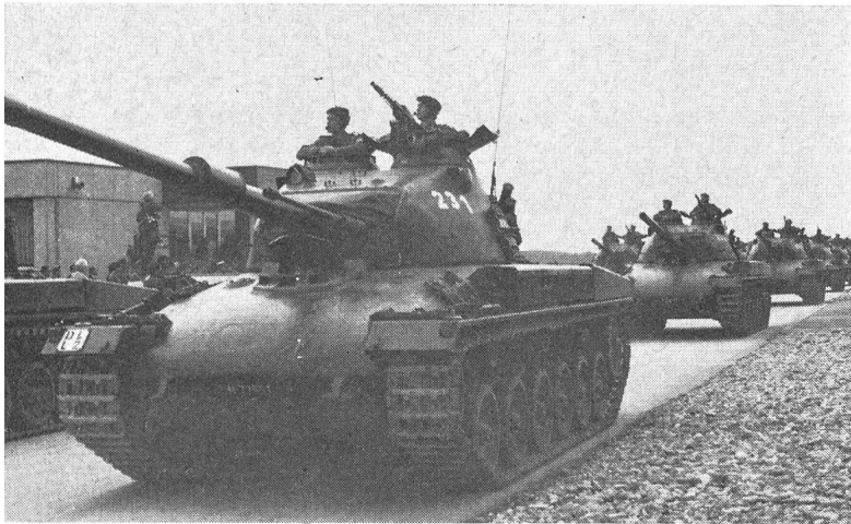
2 In Zweierkolonnen rollen unter erheblichem Lärm die noch mit ungepolsterten Ketten ausgerüsteten Panzer 61 vorbei. Sie sind mit einer 10,5-cm-Kanone und einer rohrparallelen 20-mm-Schnellfeuerkanone ausgerüstet. Auf dem Turm ist das Mg zu erkennen. Auch Panzer des neueren Typs Pz 68 wurden gezeigt.