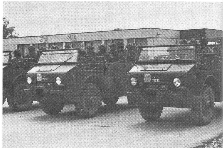
4 Die mobile Artillerie, hier mit dem Zugfahrzeug M 4 und der Haubitze 10,5 cm, ist seit kurzer Zeit (endlich) auch mit dem Kampfanzug ausgerüstet.