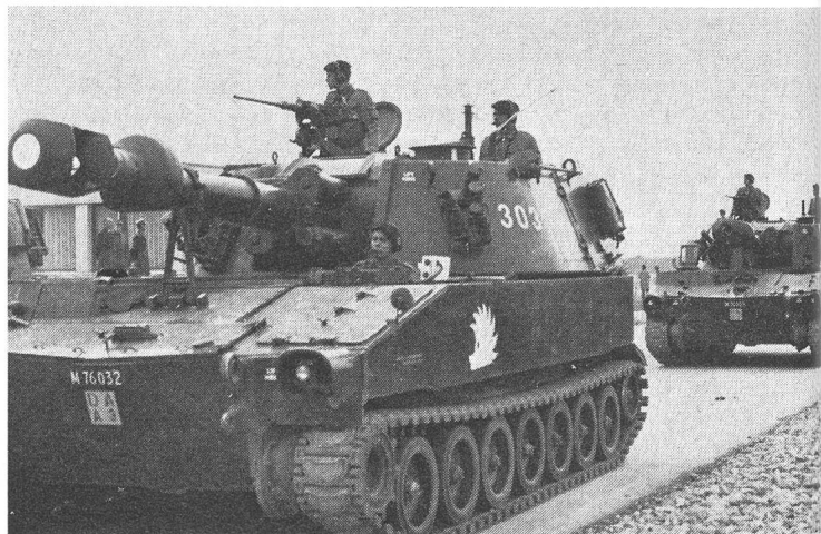
5 Das moderne Bild der Artillerie. Rekruten der Art RS 223 führen die Panzerhaubitze 66 (oder auch M 109) amerikanischen Ursprungs vor. Die Haubitze ist mit einem Rohr von 15,5 cm ausgerüstet.