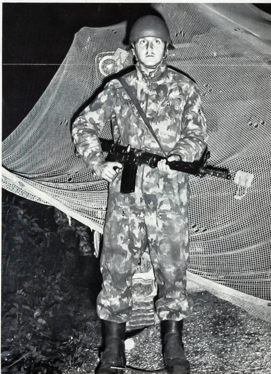
Panzergrenadier mit Sturmgewehr als Nachtwache vor einem getarnten Spz