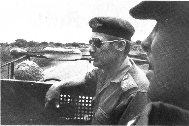
Brigadegeneral du Plessis, Kommandant eines Grenzabschnitts.