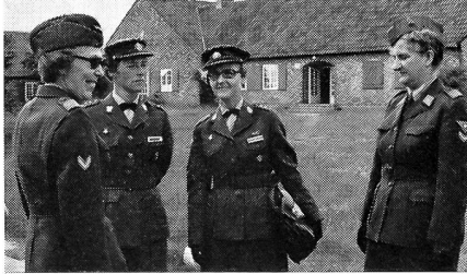
Mitglieder der Gesellschaft besuchen dänische Lottas.

Eine gesellschaftseigene Zeitung in Form der «Information» wurde abgelöst von einer «Fachinformation», da für uns als SOG-Mitglied ja die Publikationsmöglichkeit in der «ASMZ» besteht.