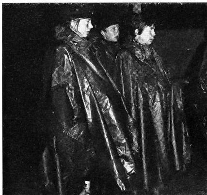
Dänische Lottas bei einer Nachtübung.

Es wurde auch versucht, Kontakt mit anderen militärischen Frauenorganisationen im Ausland aufzunehmen. So konnte im Jahre 1969 eine fünftägige Reise nach Dänemark durchgeführt werden, wo 25 DC und Kolfr einen Kaderkurs der dänischen Lottas besuchen konnten. Die Aufnahme durch die Däninnen war überaus gastfreundlich. Wir wohnten in der Kaserne und konnten uns mit den Teilnehmerinnen des Kaderkurses verpflegen. Wir erhielten «Hostessen» zugeteilt, die uns alle Fragen beantworteten. Als Pünktchen auf dem i konnten wir noch die Nachtübung in den Dünen verfolgen; anschliessend marschierten Lottas und FHD gemischt zurück zur Kaserne.