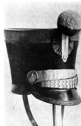
Tschako eines Füsiliers, seit 1817 bis 1829 und 1835. Alle Metallteile weiss. Pompon: unten rot, oben gelb = 4. Zentrumskompanie des Bataillons Nr. 6. Ehemalige Sammlung H. Pelet.