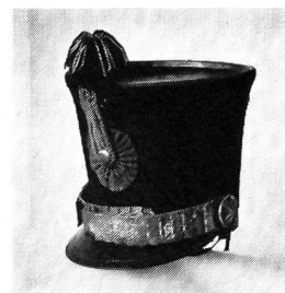
Offiziersschako, 1829—1835. Schwarzes Samtband um den obern Rand. Silberne Drahtspirale als Ganse. Reiche Sturmbänder. Silberne Fransen hängen aus dem Pompon. Ehemalige Sammlung R. Bossard.