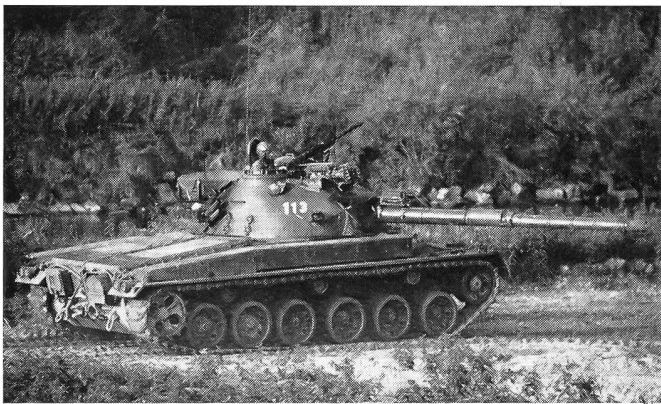
Ebenfalls gezeigt wurde der Panzer 68 AA 2, ein Gemeinschaftsprodukt der Schweizer Industrie.