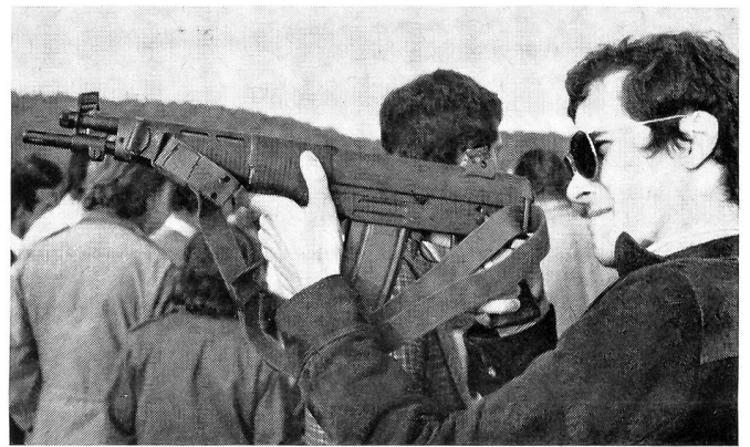
SIG-Sturmgewehr SG 543 in Kurzausführung mit Umlegekolben und 20-Schuss-Magazin. Zur gleichen Familie gehören das SIG-Sturmgewehr SG 540 mit festem Kolben und 30-Schuss-Magazin sowie das SIG-Sturmgewehr SG 540 mit Umlegekolben und 20-Schuss-Magazin.