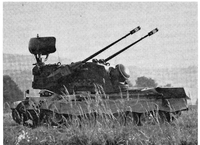
Auf grosses Interesse stiess der Oerlikon-Contraves-Flabpanzer (Typ B) für die Bundesrepublik. Im Turm des auf einem Leopard-Fahrgestell rollenden Flabpanzers befindet sich die von Contraves entwickelte Elektronik (Radar, Freund-Feind-Erkennungsanlage, Contraves-Rechner). Ausserhalb des Turmes befinden sich die beiden 35-mm-Oerlikon-Hochleistungskanonen mit einer Schusskadenz von 550 Schuss pro Minute. Die Besatzung dieses Fliegerabwehrsystems setzt sich lediglich aus drei Mann zusammen.