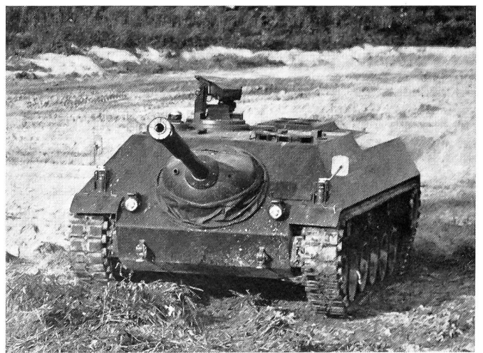
Kanonen-Jagdpanzer Gepard der Firma Mowag, 90- oder 105-mm-Kanone, 4 Mann Besatzung, Gewicht 21 t, Geschwindigkeit 70 km/h.