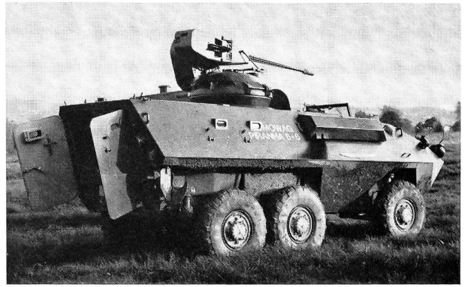
Mowag-Radpanzer Piranha 6x6, amphibisch, Bewaffnung bis 90-mm-Kanone, Raketenwerfer, Besatzung 10 Mann, Gewicht 9 t, Geschwindigkeit Strasse 100 km/h, Wasser 9 km/h.