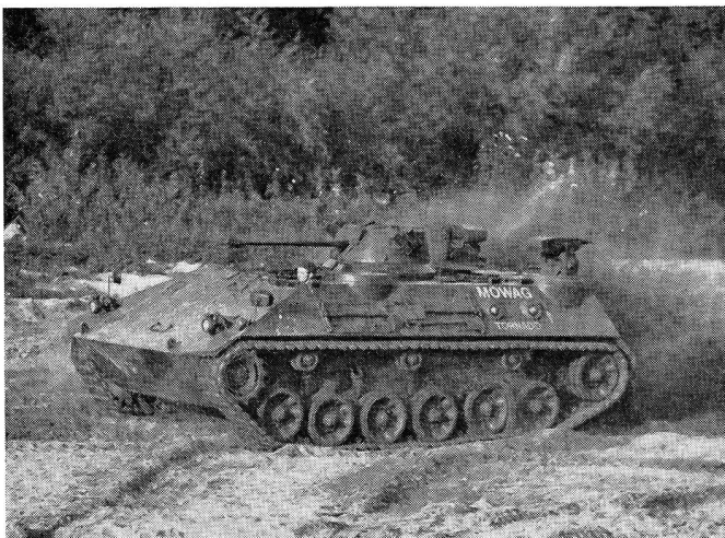
Wahrlich ein Wirbelsturm: Kampfschützenpanzer Tornado, entwickelt von der Firma Mowag. Bewaffnung bis 90-mm-Kanonen, Raketenwerfer, MW. Besatzung: 10 Mann, Gewicht: 20 t, Geschwindigkeit: 70 km/h, alle Waffen aus dem vollständig geschlossenen Fahrzeug benutzbar.

müsste mangels tauglicher Verteidigungswaffen mit erheblichen Menschenopfern erkaufte werden — Verluste, die bei geeigneter und erschwinglicher Bewaffnung vermieden werden könnten. Dabei sei zu bedenken, dass wegen der allgemeinen Wehrpflicht fast jede Familie einen oder mehrere Soldaten stelle. Es frage sich, ob man unseren Wehrmännern, von denen im Kriegsfall der Einsatz und das Opfer des Lebens verlangt werde, die notwendigen Waffen vorenthalten wolle. Nachdrücklich stellte er fest, dass im Kriegsfall nicht die Truppe für allfällige Misserfolge verantwortlich gemacht werden könne, sondern dass die Verantwortung vorab jene treffe, die es unterlassen hätten, die Armee hinreichend mit Verteidigungswaffen auszurüsten.