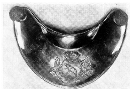
Ringkragen oder Haussecol, messingvergoldet, mit aufgeschraubtem Staatswappen, 1834. Prinz Louis Napoléon, der spätere Kaiser Napoleon III., wurde 1834 in Thun zum bernischen Artilleriehauptmann ausgebildet und brevetiert. Musée des Armes et Armures, Bruxelles.