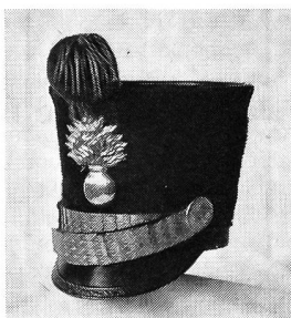
Tschako eines Artillerieoffiziers, von 1818 bis 1835. Vergoldete Granate. Rotes Pompon mit einem Büschel vergoldeter Fransen. Ehemalige Sammlung R. Bossard.