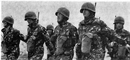
«Wenn die Soldaten durch die Stadt marschieren...»

ausgezeichneten Zielperiskop, einem Hilfvisier und einem speziellen Flabvisier, sehr gut zur Bekämpfung von Erd- wie von Luftzielen eignet. Mit der Übernahme der Spz beginnt für die Besatzungsgrenadiere endgültig die Zeit der getrennten Ausbildung. Die Ausbildung ist so umfangreich, dass die Gefechtsschulung deutlich in den Hintergrund tritt. So muss das Fahrzeug gewartet werden können, man muss lernen, damit zu fahren — wobei man sich vor allem an die neuen Abmessungen, schlechten Sichtverhältnisse und die mittels Radiuslenkhebel erfolgte Steuerung gewöhnen muss; man lernt die Kanone zu warten und zu bedienen, mit dem SE-412-Funkgerät zu funken und muss zu guter Letzt auch den leichten Geländelastwagen Pinzgauer kennen- und fahren lernen.