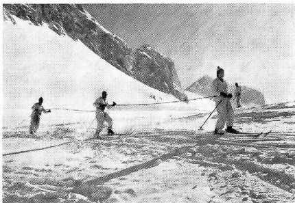
Fahren am Seil hat seine Tücken

Der Aufstieg zur Wildhornhütte des SAC begann auf der Iffigenalp. Schon die ersten Meter Aufstieg kosteten etliche Schweisstropfen, denn neben der warmen Frühlingssonne machte die ungewohnte Höhe einigen Teilnehmern zu schaffen. Nach dreistündigem Aufstieg durchs Seetal und über den Iffigensee war die Wildhornhütte erreicht. Unter der Leitung von drei Gebirgsspezialisten aus den eigenen Reihen wurde nun Gebirgsausbildung betrieben: Bau eines Schneebiwaks, Rettungsschlitzenbau, Skifahren am Seil und die Technik der Lawinenrettung waren die Ausbildungsthemen. Einmal mehr konnten so auch die Teilnehmer aus andern Waffengattungen wertvolle Erfahrungen im Gebirgsdienst machen. Schon um halb fünf Uhr war am Sonntagmorgen Tagwache, denn in der vollbesetzten SAC-Hütte musste gestaffelt gefrühstückt werden. Mit den ersten Strahlen einer herrlichen Frühlingssonne, die die schneebedeckten Gipfel erhellten, begann der Aufstieg über die letzten 900 Höhenmeter. Nach knapp zweistündigem Aufstieg war der Gipfel des Wildhorns bereits erreicht. Eine grandiose Rundschau belohnte die Teilnehmer für die Mühen des Aufstiegs. Der Anblick des einzigartigen Al-