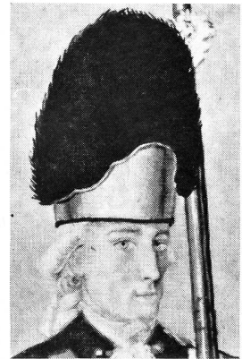
Pelzmütze eines Offiziers der Grenadiere der Freikompanie, um 1790. Aus einem Aquarell von Franz Feyerabend.