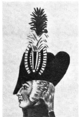
«Zuzüger aus üblichem Canton Basel. Ein Fähnrich mit der Fahne des Cantons.» Um 1792. Aus einem Aquarell von Marcus Heusler, kopiert von A. Pochon.