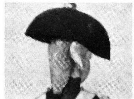
Ein Füsilier von der Füsilierkompanie Staehelin der Freikompanie der Stadt Basel, um 1792. Rückansicht. Gepuderte Haare. Aquarell von Marcus Heusler.