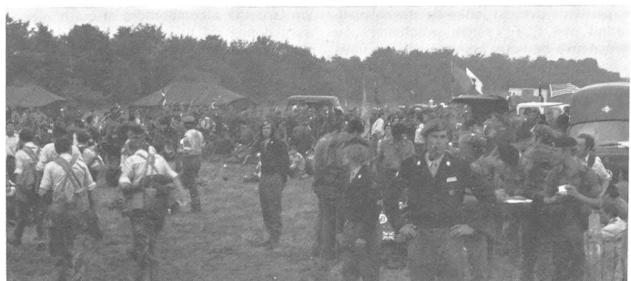
Place de repas militaire

des Armées de terre et de l'air et de la Marine décorant notre cantonnement dans l'énorme garage des PTT, nous ont appris que les Hollandaises n'ont pas de statut de complémentaires, mais sont égales aux hommes. Nous avons été impressionnées par le soin qu'accordent les étrangères au service intérieur. Ainsi, l'on pouvait voir des Scandinaves qui lavaient leurs blouses non-iron dans des cuvettes pliables, des Américaines cirant leurs Army-boots avec amour, des Anglaises repassant, des «foehns» gonflables, une Noire originaire des Antilles au fichu multicolore faisant la lessive dans un seau, et une autre Noire en battle dress et casquette de campagne repassant ses uniformes de rechange à 2 h du matin!