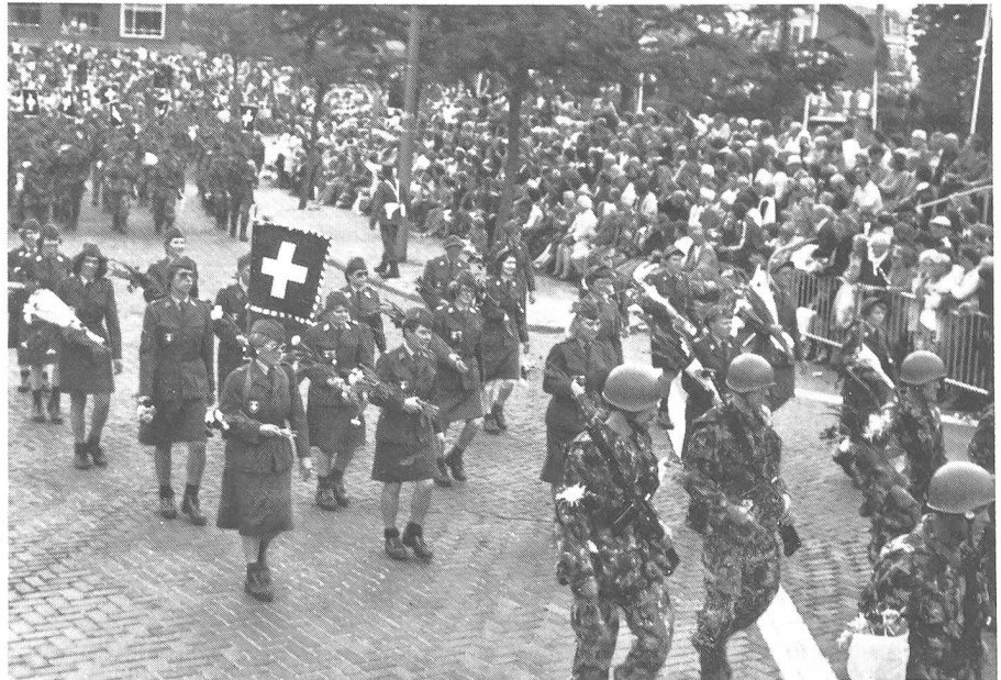
Les groupes SCF et Croix-Rouge en excellent condition physique