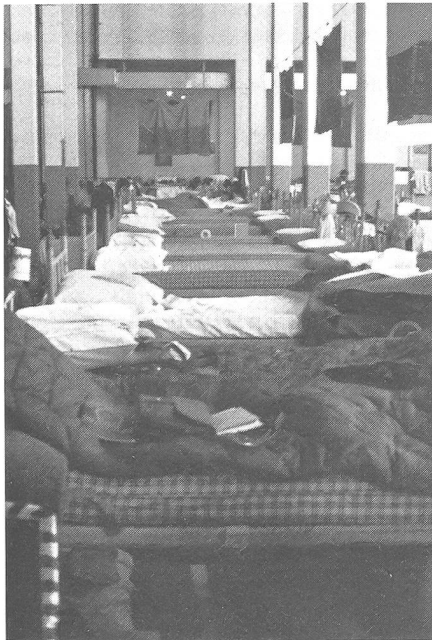
Cantonnement pour les 600 membres des services féminins dans le même local