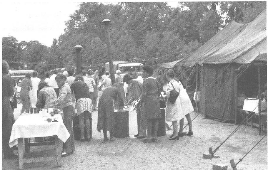
Corvée de relavage

des Armées de terre et de l'air et de la Marine décorant notre cantonnement dans l'énorme garage des PTT, nous ont appris que les Hollandaises n'ont pas de statut de complémentaires, mais sont égales aux hommes. Nous avons été impressionnées par le soin qu'accordent les étrangères au service intérieur. Ainsi, l'on pouvait voir des Scandinaves qui lavaient leurs blouses non-iron dans des cuvettes pliables, des Américaines cirant leurs Army-boots avec amour, des Anglaises repassant, des «foehns» gonflables, une Noire originaire des Antilles au fichu multicolore faisant la lessive dans un seau, et une autre Noire en battle dress et casquette de campagne repassant ses uniformes de rechange à 2 h du matin!