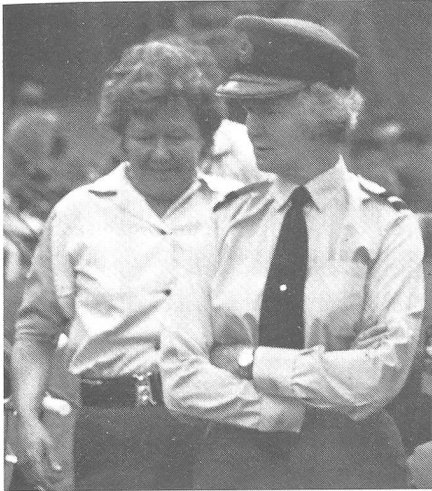
Air Commodore britannique