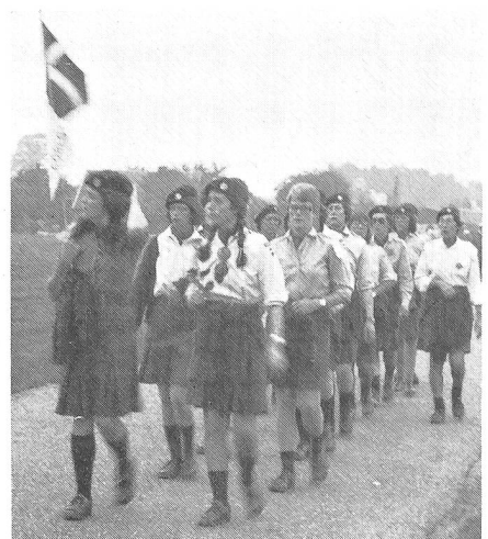
Eine der zehn dänischen Lotta-Gruppen, welche den Marsch in bester Verfassung bestand

waffe) und einiger Däninnen aus leichtem Baumwollpopeline, die Stösse elegant in die Army-Stiefel geschoben, scheinen jedoch besser geeignet zu sein. Ob die Schweizerinnen nächstes Jahr einen Versuch mit dem dunkelblauen FHD-Arbeitskleid wagen werden? Die kommende neue Uniform veranlasste uns auch, vermehrt auf die Bekleidung der Ausländerinnen zu achten. Auffallend dabei waren die verschiedenen Farben der drei Streitmächte: Marine dunkelblau, Luftwaffe hellblau und Heer beige-braun. Die nicht selten gehörte Frage, ob wir der Luftwaffe angehören, erfüllte uns mit leisem Stolz, um so mehr, als uns unterwegs der Ausspruch zu Ohren kam, ob wir Teil einer Militärharmonie seien! Wir mussten feststellen, dass ungeachtet der Mannigfaltigkeit der Arbeitstenüs (weisse Bluse mit schwarzer Krawatte und dunkelblauem, lederbesetzten und mit Gradabzeichen versehenen Pullover mit V-Ausschnitt der holländischen Marine, Battle Dress, Jupes mit oder ohne Dior-Falte, kurz- oder langärmelige Blusen, einteilige Sommeruniformkleider) alle Ausgangstenüs eines gemeinsam haben: Eine Krawatte oder Fliege. Wie werden sich wohl die Schweizerinnen in Zukunft als einzigste Nation ohne Krawatte ausnehmen?