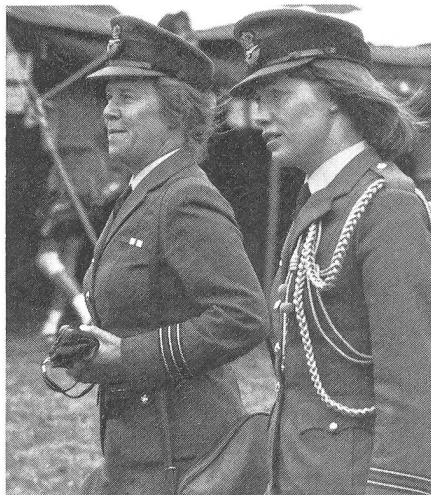
(Trotz Krawatte) charmante Offiziere der Woman Royal Air Force