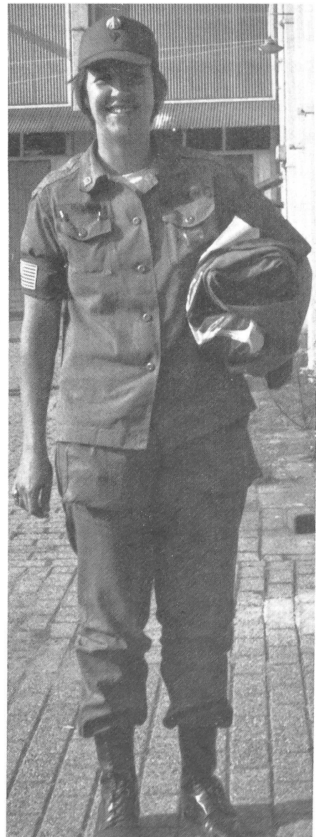
Praktisches Ex-Tenü der Amerikanerinnen