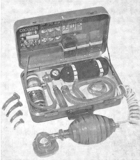
Erste-Hilfe-Koffer, Modell Modulaide Oxygen Jet