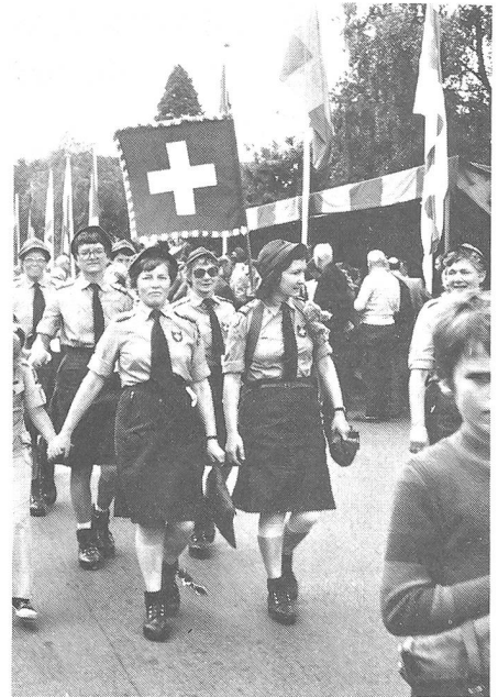
Gut gehalten haben sich auch unsere beiden Damengruppen des FHD und des Rotkreuzdienstes, hier beim Durchmarsch in Groesbeek am dritten Tag.

Mehr als viele Worte zeigen die folgenden Bilder, eine bunte Palette vielfältiger Eindrücke. Nie kann der «Vierdaagse» mit seiner Atmosphäre voll geschildert werden, denn man muss selbst dabeigewesen sein und ihn erlebt haben.