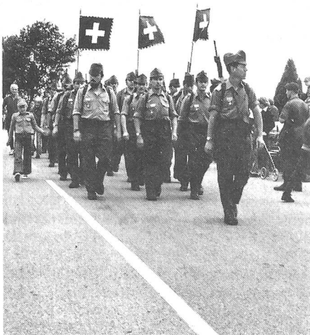
22 Marschgruppen der Schweizer Armee führten dieses Jahr am «Vierdaagse» stolz ihre Armeestandarten durch drei Provinzen der Niederlande; hier die Gruppen des Schweizerischen Verbandes Motorisierter Leichter Truppen, drei Gruppen, die immer zusammenblieben.