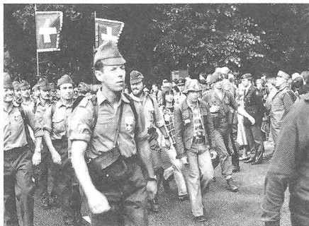
Die beiden Marschgruppen «Bärner Mutze» und «Les Chevrons» unterwegs auf Hollands Strassen. Überall säumten die Bewohner der Städtchen und Ortschaften die Strassen, um den Wanderern aus aller Welt Beifall und Erfrischungen zu spenden.