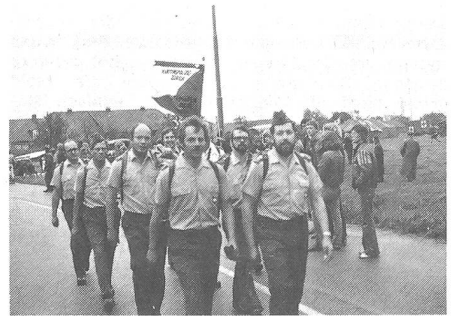
Unterwegs getroffen: Gruppe der Kantonspolizei Zürich, eine der zahlreichen Gruppen städtischer und kantonaler Polizeikörpers aus der Schweiz.