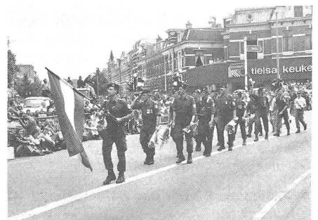
Einmarsch der kleinen Gruppe des Österreichischen Bundesheeres in Nijmegen am vierten und letzten Marschtag.