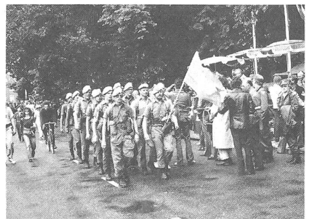
Auch die Blauhelme der UNO, kenntlich an den blauen Berets, waren mit einer flotten Marschgruppe vertreten.