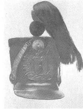
Zylindrischer Tschako eines Landjägers. Um 1843. Rotes Pompon. Weisse Tulpe. Roter Haarbüsch. Kokarde innen weiss, rot. Alle Metallteile gelb. Ehemalige Sammlung H. Pelet.