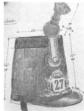
Tschako des Infanteriebataillons Nr. 27. Nach 1846. Bataillonsnummer ausgeschnitten und rot unterlegt. Musée militaire vaudois, Morges.