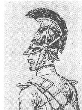
Bürstenhelm der reitenden Jäger, 1847—1852. Zeichnung von L. Rousselot für «Schweizer Uniformen», Tafel 90.