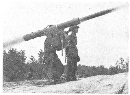
Das Fliegerabwehrsystem RBS 70 ist eines jener Projekte, das von den Schweden und Schweizern gemeinsam entwickelt worden ist.