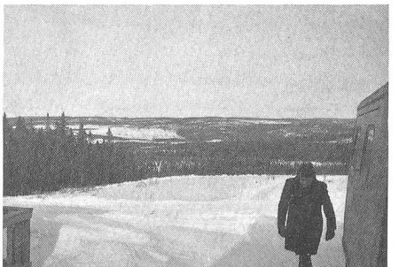
Typisches Landschaftsbild im nördlichen Teil Schwedens. Wenig Wege, viel Wald und feuchter Boden.