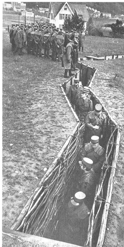
Unsere Bilder zeigen einen Teil der Besucher in der militärischen «Gartenanlage» für Feldbefestigungen auf dem Waffenplatz Brugg.