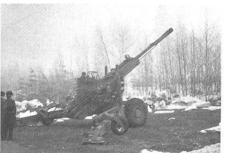
An der Feldhaubitze 77, 15,5 cm, ist unser Land interessiert. Dank eigenem Antrieb fährt die Haubitze nach der Trennung vom Zugfahrzeug «selber» in Stellung.