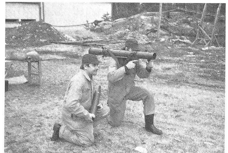
Das schwedische Panzerabwehrsystem Carl Gustaf, das gegenwärtig in der Schweiz einer Erprobung unterzogen wird. Es könnte allenfalls als Nora-Ersatz Verwendung finden.