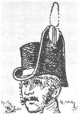
Füsilier mit Zeittafelhut, 1813. Berner Handschrift, Seite 60. Pompon hellblau, Kokarde innen hellblau-grau-weiss. Zeichnung von L. Rousselot für «Schweizer Uniformen», Tafel 109.