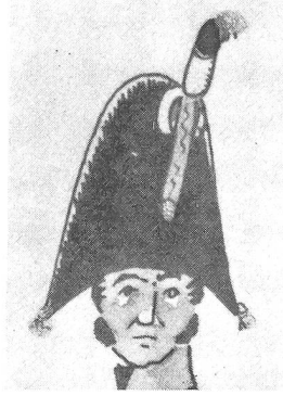
Offizier im Zweispietz, 1813. Berner Uniformhandschrift, Seite 93. Pompon unten weiss, oben rot, mit Silberfransen. Kokarde innen hellblau-grau-weiss.