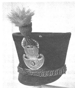
Tschako eines Infanterieoffiziers, um 1825. Pompon unten hellblau - Silberkordel - weiss. Kokarde innen blau-grau-weiss. Alle Metallteile gelb oder vergoldet. Ehemalige Sammlung H. Pelet.