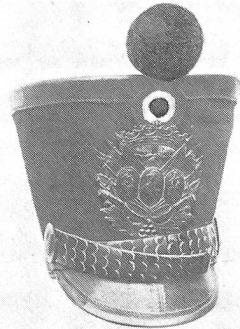
Tschako eines Artillerieoffiziers, um 1825. Pompon rot. Kokarde innen hellblau-weiss-grau. Metallteile gelb. Ehemalige Sammlung H. Pelet.