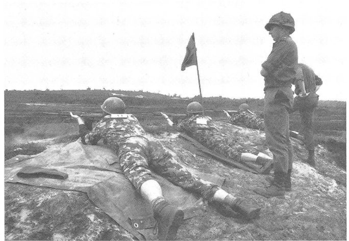
Die Nidwaldner Kameraden versuchen es Wilhelm Tell gleichzutun