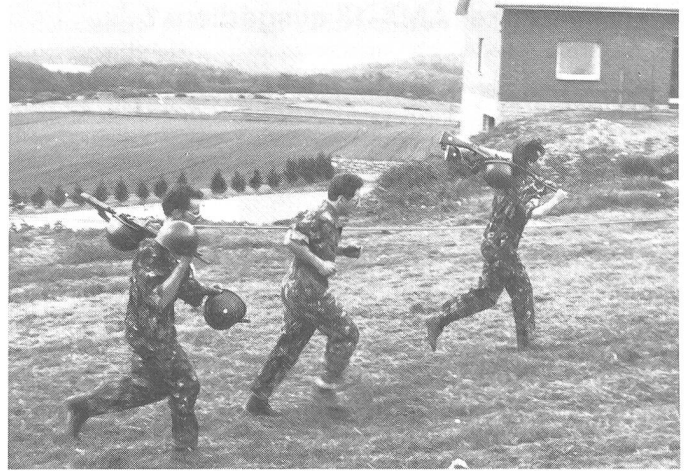
Nur noch wenige Meter trennen die Züriseebuebe vom Ziel