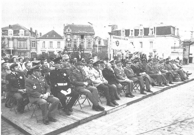
Die Galerie der Prominenz