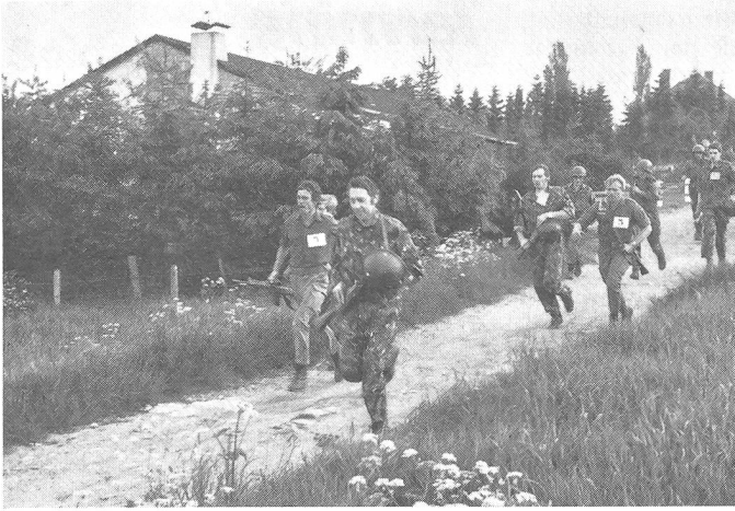
Unsere welschen Kameraden kurz nach dem Start zum Eilmarsch