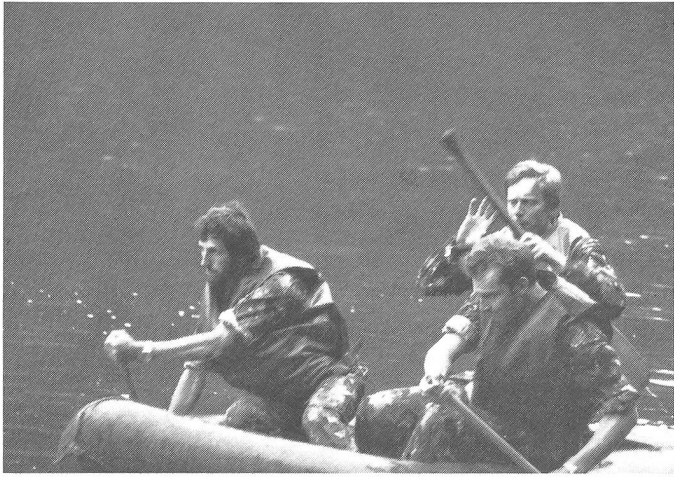
«Eine Seefahrt, die ist lustig, eine Seefahrt, die ist schön . . .» Die verbissenen Gesichter der drei Kameraden lassen jedoch auf das Gegenteil schliessen.