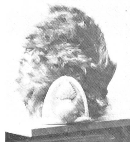
Grenadiermütze des Regiments Estavayer, 1785. Dunkelbraunes Bärenfell, rotes Schild, gelbe Granate und Umrandung. Sammlung L. Rousselot, Paris.