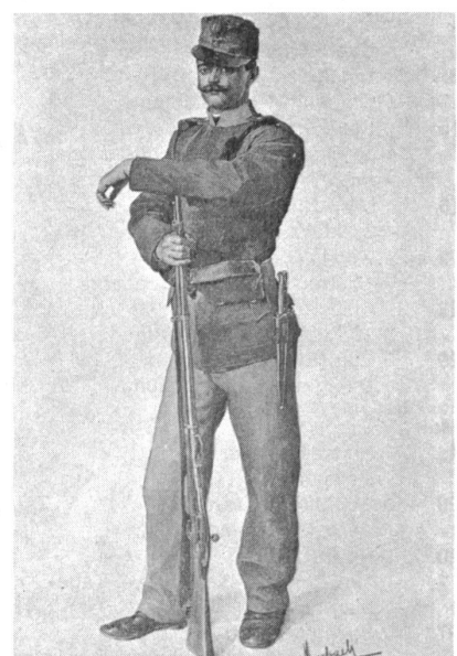
Infanterist, 1900 (Deutschmeister), nach einem Aquatell von F. Myrbach-Rheinfeld.