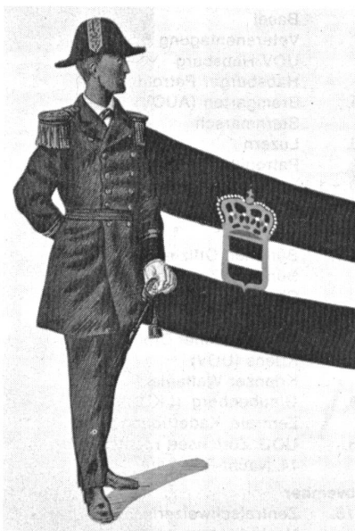
Marineoffizier (1908), nach einer Lithografie von C. Righetti.