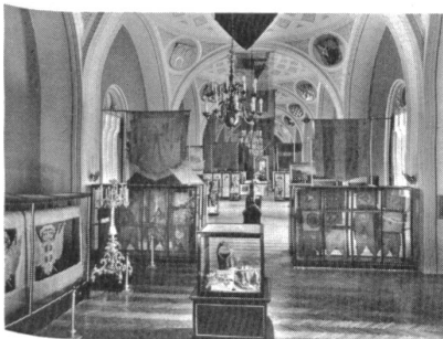
Prinz-Eugen-Saal (Saal des 17. Jahrhunderts)

Schön und lehrreich ist die Demonstration der Entwicklung von Uniformen und Kopfbedeckungen, die, auf Puppen gezeigt, den zeitlichen Rahmen des 19. Jahrhunderts vielfach sprengen und stellenweise bis 1918 reichen. – Die Ära des Kaisers und Königs Franz Joseph (1848-1916) führt uns bis zum Ersten Weltkrieg. Der den grossen Weltbrand einführenden Ermordung des österreichisch-ungarischen Thronfolgerpaars in Sarajewo (Bosnien/Jugoslawien) ist ein eigener Raum gewidmet. Die Uniform von Franz Ferdinand und das Auto, in dem die Tat im Sommer 1914 verübt wurde, sowie eine Reihe von Fotos und Dokumenten führen das Geschehene plastisch vor Augen. – Eine gewisse Enttäuschung bereiten die Säle, die dem Ersten Weltkrieg gewidmet sind. Obwohl man einige äusserst interessante Gegenstände zu sehen bekommt (zum Beispiel die originale k. u. k. Haubitze M 16 vom Kaliber 38 cm oder die Autokanone M 15 vom Kaliber 15 cm) erhält der Besucher kein umfassendes Bild von den vier Jahren Krieg der multinationalen Armee der Donaumonarchie an den verschiedensten Fronten und Feldzügen. Es fragt sich, ob dies möglicherweise mit der politischen Zurückhaltung zusammenhängt, die die heute unter kommunistischer Herrschaft lebenden sogenannten Nachfolgestaaten der k. u. k. Monarchie in ihrem nationalen Stolz scho-