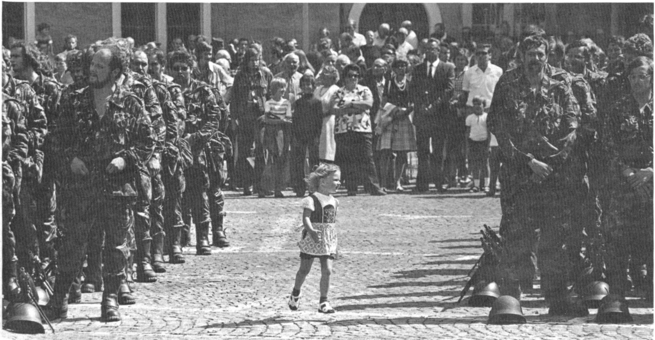
Inspektion durch eine künftige FHD.

Endlich konnte der Flüchtling durch Ritzen in den Holzwänden des Güterwagens feststellen, dass er sich dem Grenzort Komati Poort näherte. Er verzog sich ganz ins Innere seiner kleinen Wollfestung, streckte sich auf dem Boden aus und deckte sich mit einem Stück Sackleinen zu, weil er eine peinliche Kontrolle der Ladung erwartete. Klopfenden Herzens verharrete er so längere Zeit. Obschon überall auf der nun angelaufenen Station Stimmen, Rufe und Gepfeife zu vernehmen waren, wurde die Deckplane des Wagens nicht abgehoben, und nach einigem Manövrieren ratterte der Zug endlich weiter. Die Grenze musste nun passiert sein. Der Flüchtling atmete jubelnd auf. Noch vor der Einfahrt in den Güterbahnhof von Lourenço Marques säuberte er seinen Schlupfwinkel von allen Überresten des mitgegebenen Proviant, um später niemandes Aufmerksamkeit zu erregen, und dann verliess er den stehenden Zug als freier Mann. Er suchte in der Stadt das britische Konsulat auf, wo man ihn freudig begrüsst und jede Hilfe angedeihen liess. Diese spektakuläre Flucht hat Churchills Namen in ganz Europa bekannt werden lassen und viel zu seinem späteren unerhörten Aufstieg beigetragen.