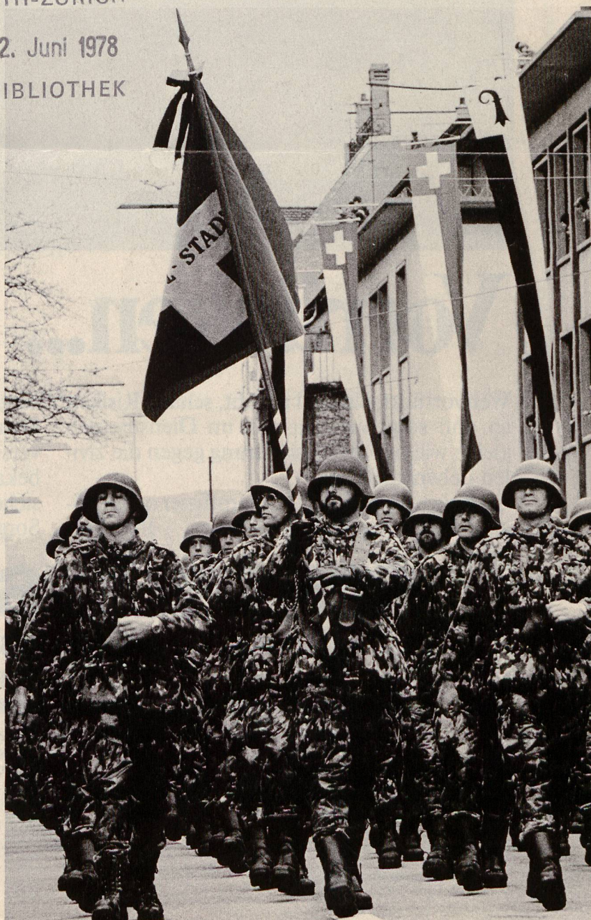
Fahne eines baselstädtischen Füsillierbataillons