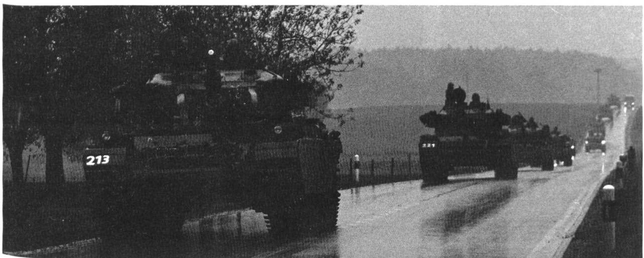
Panzermarsch im Regen