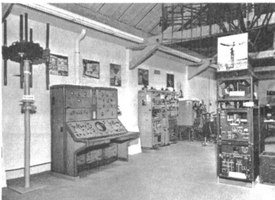
Peiler, Konsolen und das Radargerät LGR 1