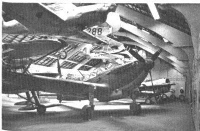
Flugzeughalle: vorne ein C-3603, darüber ein Messerschmitt ME-108 Taifun.

Am 2. Mai 1978 konnte in Dübendorf das Museum der schweizerischen Fliegertruppe im Beisein zahlreicher Politiker, Vertreter der Wissenschaft, der Industrie und der Armee offiziell eröffnet werden. Dass das Museum gerade in Dübendorf eingerichtet werden konnte, ist kein Zufall, wird doch dieser Ort als Wiege der schweizerischen Militäraviatik bezeichnet. Der erste Flug in Dübendorf fand am 20. Oktober 1910 statt. Ferner stehen an dieser Stelle Hangars aus den Zwischenkriegsjahren, die nun für das Ausstellungsgut weiterverwendet werden. Auf beschränktem Platz findet der Besucher konzentriertes Anschauungsmaterial über die Entwicklung des militärischen Flugwesens in den letzten 60 Jahren. Warum nun hierfür ein besonderes Museum? Seit dem Ersten Weltkrieg hat auf dem Gebiet der Aviatik eine rasche Entwicklung stattgefunden, wie in nur wenigen Sparten der Technik. Es ist deshalb verdienstvoll, dass sich die Abteilung der Militärflugplätze bemühte, das bei ihr eingelagerte Material einem breiten Publikum zugänglich zu