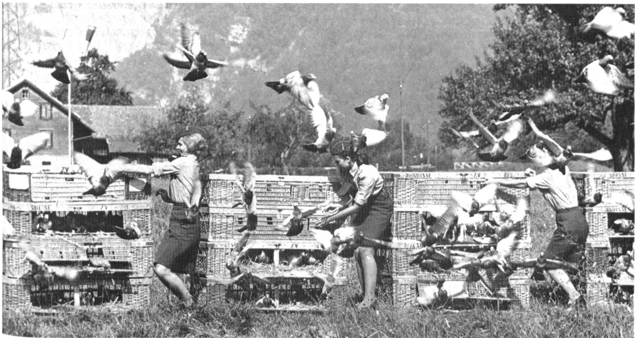
Auf los geht's los!

Anmeldungen nimmt entgegen: E. Steiner, Rosenbergstrasse 41, 8630 Rüti ZH Telefon 055 31 23 33