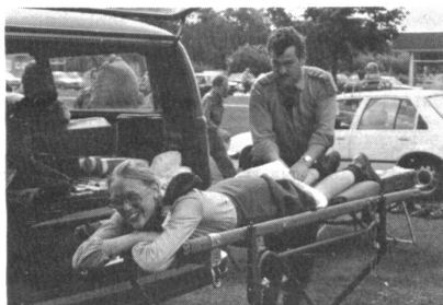
Die Sanitätsposten waren nie arbeitslos.