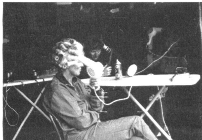
Offensichtlich wird auch mit dem Kopf marschiert.