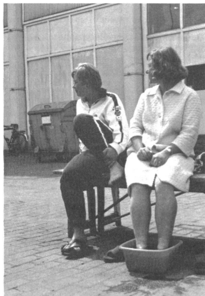
Das allabendliche wohltuende Fussbad in Kaliumpermanganat.