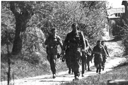
Jägergruppe beim Marsch