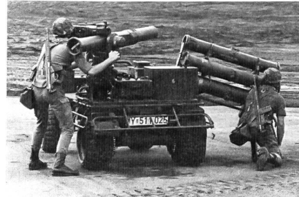
Fallschirmjäger stellen die Einsatzbereitschaft einer Panzerabwehrwaffe TOW auf KraKa her.