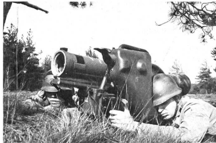
Jägerunteroffizier als «Milanschütze»