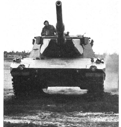
Nicht nur der Kampfpanzer Leo, sondern eine Vielzahl von gepanzerten Fahrzeugen beherrscht die Szene in Munster.

Das Bild der Bundeswehr ist sehr stark von gepanzerten und mechanisierten Waffensystemen und Kampfverbänden geprägt, deren Entwicklung, Handhabung und Instandhaltung eine Vielzahl von berufsspezifischen und technischen Fertigkeiten erfordert. Die Kampftruppenschule II – der auch die Fachschule des Heeres für Erziehung angegliedert ist – schafft im typischen Panzergebäude bei Munster in der norddeutschen Lüneburger Heide den erforderlichen Organisationsrahmen und bietet die benötigten Ausbildungskapazitäten. Panzertruppe, Panzeraufklärer und Panzergrenadiere mit Panzerjägern sind in dem weitverzweigten Komplex von Kasernenanlagen und Truppenübungsplätzen Munster-Bergen daheim.