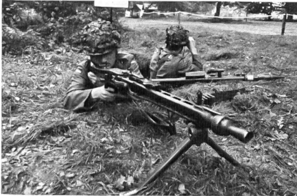
Maschinengewehrstellung, daneben leichte Panzerabwehrwaffe.