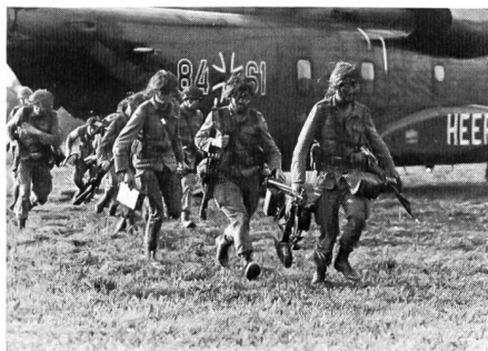
Jäger werden mit Grossraumhubschraubern per Lufttransport angelandet.