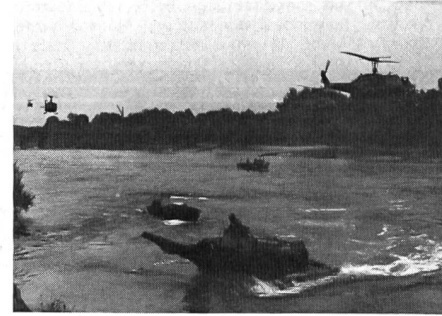
Das Heer in allen drei «Elementen».