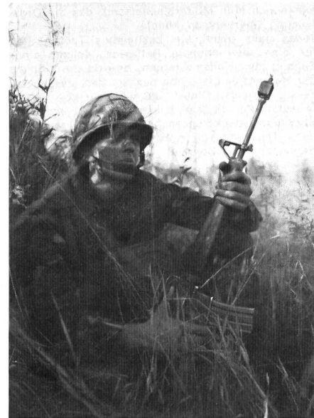
Neuerdings sind die «Marines» stark im nördlichen Europa vertreten.

menarbeit zwischen den Verbänden der verschiedenen Nationen erprobt und gefestigt wurden.