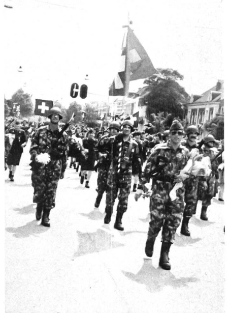
Die Spitze des Schweizer Marschbataillons am vierten Tag beim Einzug in Nijmegen.