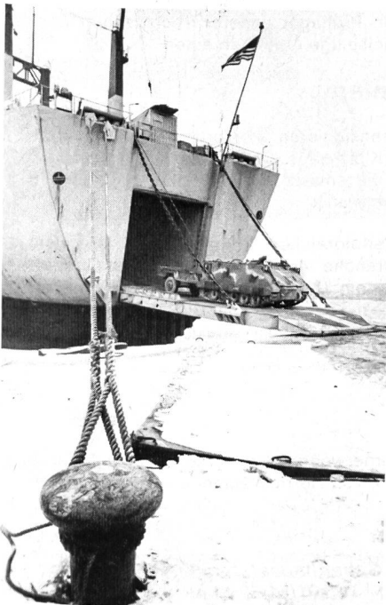
Gepanzerte Transporter aus den USA im Hafen von Antwerpen.

Die frei verlaufende Übung begann am 30. Januar und sollte am 7. Februar enden. Ein plötzlich