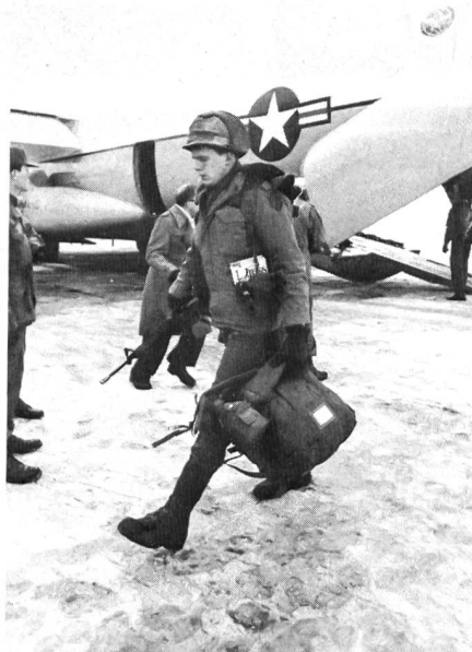
Soldaten der 1. Infanteriedivision aus Kansas bei der Ankunft auf dem US-Flugplatz Ramstein in der Bundesrepublik.

eintretender Witterungsumschwung veranlasste jedoch die Manöverleitung, das Vorhaben vorzeitig zu beenden, nachdem die schweren Panzerfahrzeuge schon Schäden in der Höhe von 2,28 Millionen DM verursacht hatten. Übungsraum war Nordbayern und der nordöstliche Teil von Baden-Württemberg, besonderer Übungszweck neben der taktischen und logistischen Zusammenarbeit auch das Überqueren und Überwinden von Wasserläufen.