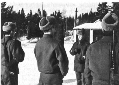
Unteroffiziere bei der Formalausbildung

Auch in Finnland gibt es die allgemeine Wehrpflicht. Die Unteroffiziere sind jedoch stark spezialisiert und befinden sich im Berufsstatus. Sie nennen sich offiziell Fachdienstoffiziere und können auch entsprechende Offiziersgrade erreichen. Der Übergang zur Laufbahn der Truppenoffiziere ist nach Ablegung von Prüfungen und Gewährleistung persönlicher Eignung recht vereinfacht. Die Ausbildung der Fachdienstoffiziere erfolgt an eigenen Schulen. Die Laufbahn-