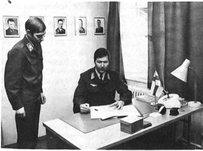
Höherer Unterführer bei der Besprechung mit einem Kommandanten

struktion bietet die rechtliche Grundlage für die Zahlung eines Gehalts, ebenso gibt es für den Zeitraum des Schulbesuches ein zusätzliches Tagegeld. Überstunden werden nach den Prinzipien des staatlichen Arbeitszeitgesetzes den Soldaten voll vergütet.