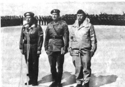
Die Kommandeure der sowjetischen, polnischen und ostdeutschen Marinestreitkräfte in der Ostsee beim Rapport nach abgeschlossener Übung.