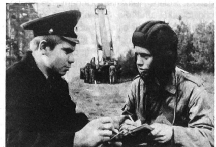
«Gemeinsame Ausbildung mit den Genossen vom «Regiment nebenan»... – Propagandafoto, die zeigen soll, wie Soldaten der DDR und der SU bei Übungen und in der Freizeit «brüderliche Waffengemeinschaft» praktizieren.