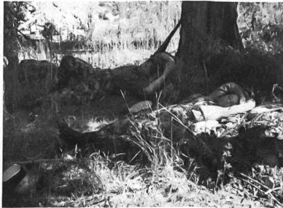
So ne Kämpfer isch ä gäbigi Sach!

Am Samschtig no nä Gasmasketürk mit Tränegas, mir hei do all gseh, uf eusi Schutzmaske isch Verlass.