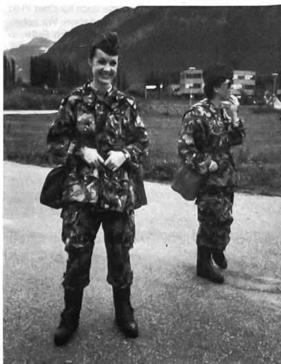
Zwei FIBMD-FHD in ungewohntem Tenue.

I bi am Mentig am Morgen am Fümfi z' Lieschtel uf em Bahnhof gschtande, zwo Poschtbeamtin hei, wo si mi gseh hei, grad d' Wält nüm vrschtande, i hätt doch uf Sitte in EK selle! – so foht das Gschichtli a, woni do wett vrzelle.