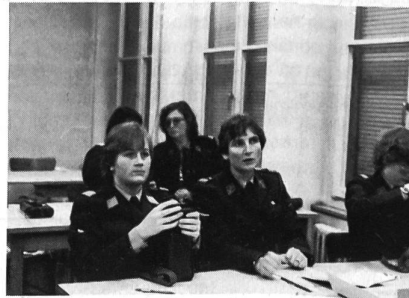
Eine Lektion über Gebrauch und Anwendung des SE-125 ging der praktischen Übung voraus.

Diszipliniert sein! Aufmerksam sein! Nicht unnötig ausstrahlen! Sein Funkgerät beherrschen! Sein Funknetz kennen! Richtig reagieren (jeder Funker muss wissen, wie er sich gegen Aufklärung, Störung und Täuschung zu verhalten hat)! Melden (Störung und Täuschung)! Verbindung halten!