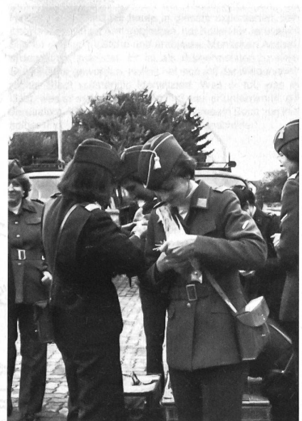
«Von einer FP Grfhr lasse ich mir das gerade noch gefallen!» sagt sich die Taube und hält schön still.

(mit FHD) anzutreffen. Zu Übermittlungszwecken können sie jederzeit von allen Einheiten angefordert und benützt werden. Nach kurzer Instruktion ist es jedem Wehrmann möglich – davon konnten sich die Grfhr überzeugen –, die Briefftaube mit einer Meldung zu versehen und sie zu starten. Das Gefieder der Tauben kennt verschiedene Farben. Der meist private Züchter achtet darauf, dass die Farbe seiner Vögel möglichst mit derjenigen des umliegenden Geländes harmoniert, um sie durch diese natürliche Tarnung vor ihren grössten Feinden, den Raubvögeln, zu schützen. Züchter mit A-Schlägen stehen bei der Armee unter Vertrag und müssen einen Sollbestand an Tieren regelmässig trainieren und einsatzbereit halten. Tiere