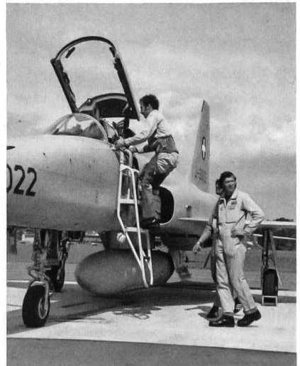
Ein Tiger-Pilot besteigt das Flugzeug zum nächsten Einsatz. Unter dem Rumpf ein 1000-l-Zusatztank.