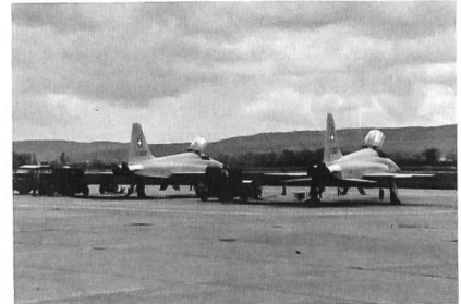
Tiger werden startbereit gemacht.