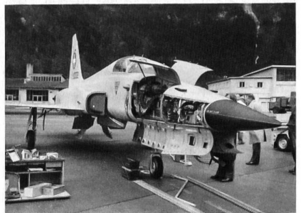
Der Tiger zeigt seine Zähne. Im Bug zwei 20-mm-Maschinenkanonen und die Bordelektronik.