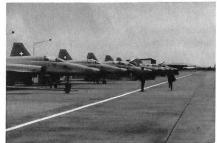
Einsatzbereite Tiger in Reih und Glied.