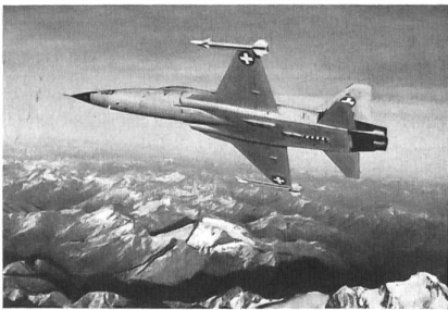
Raumschutzjäger Tiger über den Schweizer Alpen. Militärluftdienst