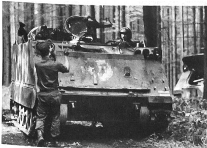
M-113 zieht im Wald unter.