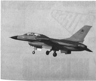
Three View Aktuell