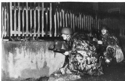
Kriegsmässiges Vorrücken über den Bözberg.

Die Absolventen der G UOS 35, über deren Leistungsprüfungen wir oben berichteten, waren die ersten Brugger Unteroffiziere, die – auf dem Weg zur Beförderungsfest in der altherwürdigen Hofstatt – durch die Vorstadt an ihrem Schulkommandanten und vielen Verwandten und Bekannten vorbeidefiliierten.