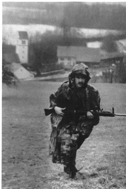
Von der Kirche Kirchbözing (Bild) her ging es kriegsmässig – und in strömendem Regen – bergan Richtung Oberbözing-Bürersteig.