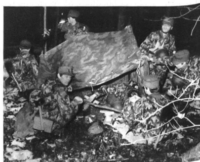
Getarntes Abkochen im dunklen Forst.