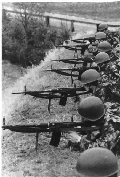
«Feuer frei!» beim Gefechtsschiessen.