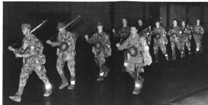
Mitternacht ist vorbei – das Ziel (die Kaserne Brug) erreicht.