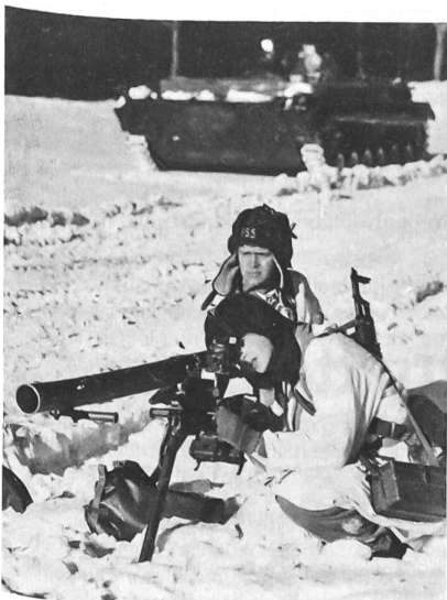
Panzerjäger der Nationalen Volksarmee mit rücksichtsfreiem Geschütz.

159 000 Soldaten. Die Landstreitkräfte umfassen davon 187 000 Mann und sind in zwei Panzer- und vier motorisierten Schützendivisionen sowie zentrale militärische Dienststellen und Wehersatzbehörden gegliedert. Die Luftstreitkräfte/Luftverteidigung hat 36 000 Mann und verfügt über 335 Flugzeuge verschiedener Art. Die Volksmarine zählt 16 000 Angehörige und hat ausser zwei modernen Fregatten eine ganze Reihe von Schiffen für verschiedene Verwendung. Über 300 000 ausgebildete Reservisten stehen der Nationalen Volksarmee zur Verfügung. Die Grenztruppen und die Arbeitermiliz zählen insgesamt 600 000 Mann. Hinzu kommen noch die Truppen für die innere Sicherheit in einer Gesamtstärke von 25 000 Mann.