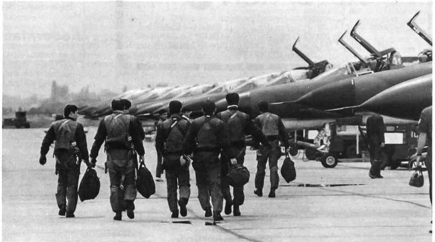
Auf der Flugwaffenbasis Eskisehir begeben sich Piloten zu ihren einsatzbereiten Maschinen vom Typ Phantom F-4E.

Bei einer Bevölkerungszahl von etwas über 42 Millionen Menschen, einem geschätzten Bruttosozialprodukt von 46,6 Milliarden Dollar und Verteidigungsausgaben von 1,7 Milliarden Dollar unterhält der NATO-Partner Türkei derzeit eine Streitmacht von 485000 Mann. Davon entfallen deren 390000 auf das Heer, 45000 auf die Marine und 50000 auf die Flugwaffe. Zu etwa drei Vierteln besteht diese Mannschaft aus Wehrpflichtigen, durchwegs hervorragende Soldaten, die innerhalb der obligatorischen Dienstzeit von zwanzig Monaten ausgebildet werden. (Vgl. die untenstehenden Bilder)