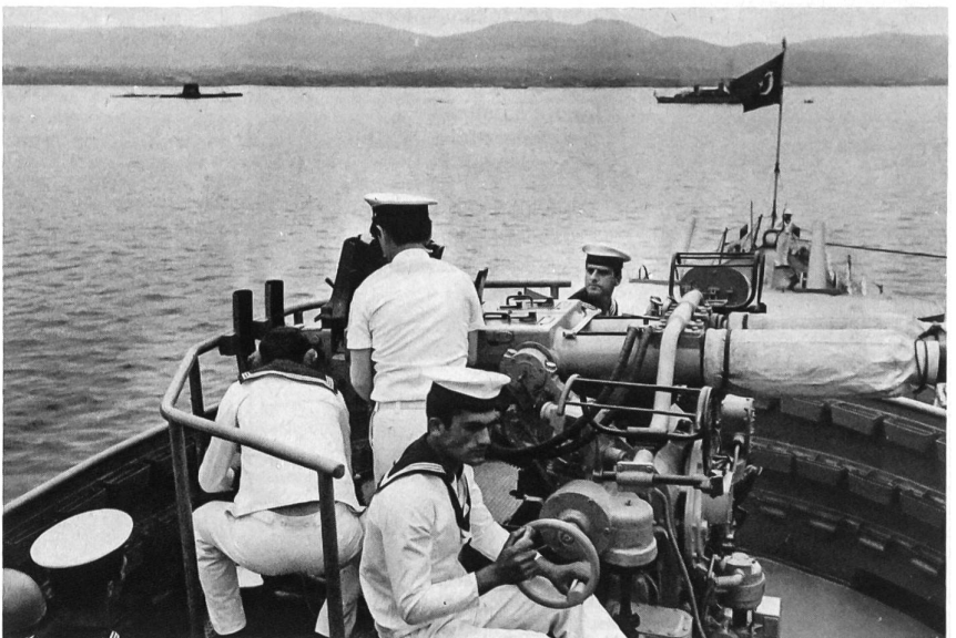
Marineeinheiten in der Basis von Colcük. Auf dieser Basis sind zwei Typen Unterseeboote stationiert: ein US-Modell «Guppy» von 2000 t und 86 Mann Besatzung und das in Lizenz gebaute deutsche Modell «U 209» mit 1000 t und 35 Mann Besatzung. Dukas