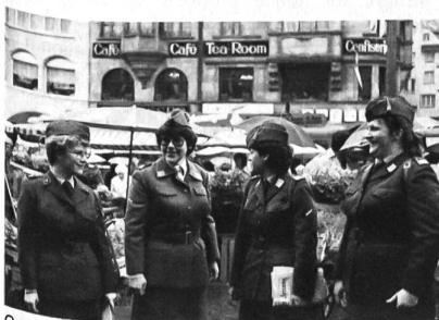
Gutgelaunte Delegierte auf Basels Marktplatz.

Ich danke Ihnen und allen Angehörigen des FHD im allgemeinen und Ihrem Verband und seinen aktiven Mitgliedern im besonderen für die wertvollen Dienste für Frieden und Unabhängigkeit. Ich grüsse mit besten Wünschen für eine erfolgreiche Tagung und für Ihr persönliches Wohlergehen.