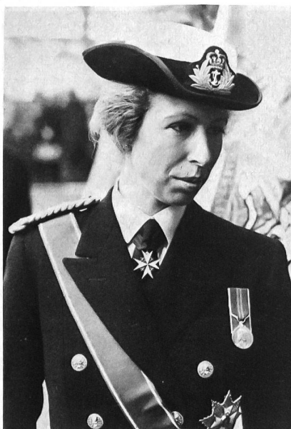
Prinzessin Anne von England: Auch eine FHD!

In einem Restaurant im Gelände der GRÜN 80 traf man sich zum zweiten Teil der Delegiertenversammlung. Bei Tafelmusik und angeregten Diskussionen, unterbrochen von kurzen Ansprachen verschiedener Gäste, genoss man