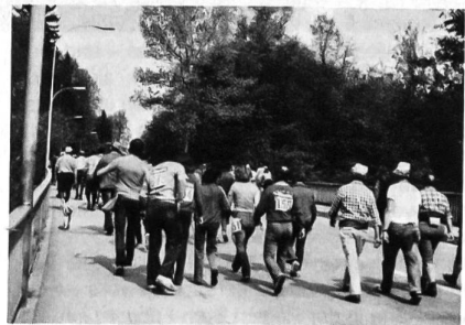
Sehr unterschiedlich sah das Tenü aus, in dem die insgesamt 1698 Läuferinnen und Läufer zum Burgdorfer 60-km-Lauf antraten.