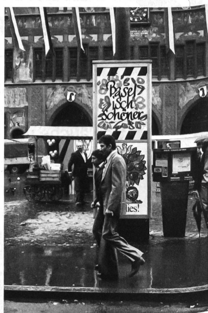
...auch bei Regenwetter.

Am 10. April dieses Jahres durfte der Frauenhilfsdienst der Armee sein 40jähriges Bestehen feiern. Ich benütze den Anlass der diesjährigen Delegiertenversammlung des Schweizerischen