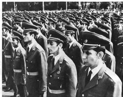
Ausmusterung von Offizieren. Parade in Budapest

Als paramilitärische Truppen muss man noch die Grenzwache mit ihren 15000 Mann erwähnen. Sie ist – nach sowjetischem Muster – dem Innenministerium unterstellt. Ihrerseits umfasst die Arbeitermiliz ca. 45000 bis 50000 Angehörige – hauptsächlich bewährte Parteifunktionäre der unteren Ebene und Jungkommunisten. Insgesamt stehen also in der Ungarischen Volksrepublik mit einer Gesamtbevölkerung