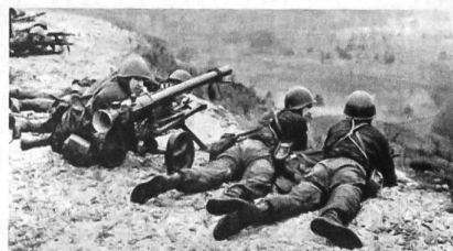
Wirklichkeitsnahe Ausbildung in der Volksarmee. Seit geraumer Zeit werden die Rekruten – nach einem einheitlich gestalteten Ausbildungsplan des Warschauer Paktes – in Sonder-Übungslagern ausgebildet. Sie müssen sich dabei wie «auf einem richtigen Schlachtfeld» fühlen. Das Bild zeigt eine solche Übung