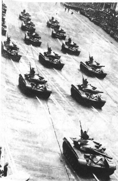
Militärparade in Budapest April 1980. Die neue T-72 Panzer der Volksarmee während der Parade

von 10,7 Millionen Einwohner ca. 160 000 Personen unter Waffen. Der Grunddienst in der Volksarmee beträgt im allgemeinen zwei Jahre, wobei der Staat die Möglichkeit hat, diese – bei einer eventuellen