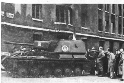
Ungarische Panzersoldaten an der Seite der Aufständischen, Oktober 1956 in Budapest. (Am Sturmgeschütz sowjetischer Bauart die National-Fahne und auf dem Turm des Fahrzeuges «Kossuth-Wappen», Symbol der Aufständischen)

Zwischen 1949 und 1956 wurde Ungarns Streitmacht vollständig nach sowjetischem Muster