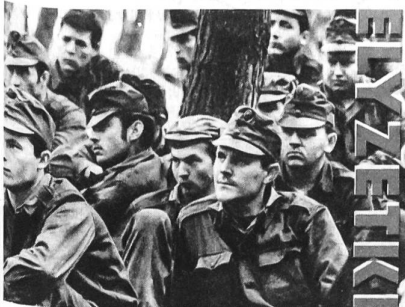
Ungarische Soldaten der siebziger Jahre