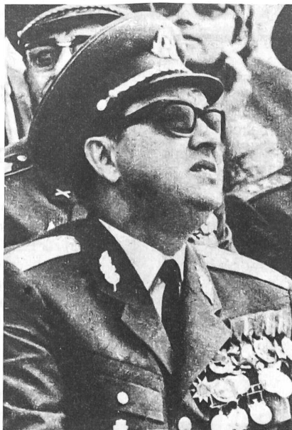
Armeegeneral Lajos Czinege, Verteidigungsminister Ungarns seit 1961

organisiert und sowohl innerlich als auch äusserlich (Uniformen!) der Roten Armee ähnlich gemacht. Die Früchte dieser Art der Sowjetisierung ernteten die Kommunisten im Oktober 1956. Der