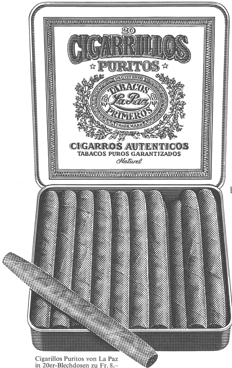
Cigarillos Puritos von La Paz in 20er-Blechdosen zu Fr. 8.- Nur im guten Fachhandel.

Cigarillos geniessen in Kennerkreisen wenig Zutrauen. Das oft zu Recht. Denn das Verhältnis von Innengut zu Um- und Deckblatt kann bei kleinen Cigarren die Geschmacksharmonie beeinträchtigen, da für eine ausgewogene Mischung kaum noch Raum bleibt.