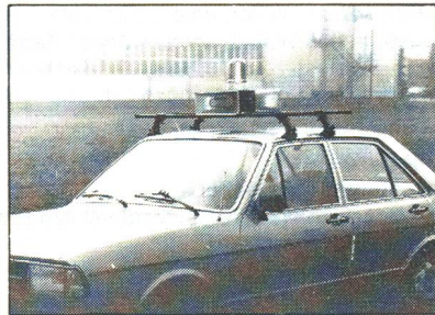
Alarmeinheit für den mobilen Einsatz

Pneumatische Hochleistungs-Sirene für Kernkraftwerke, Zivilschutz und Feuerwehr.